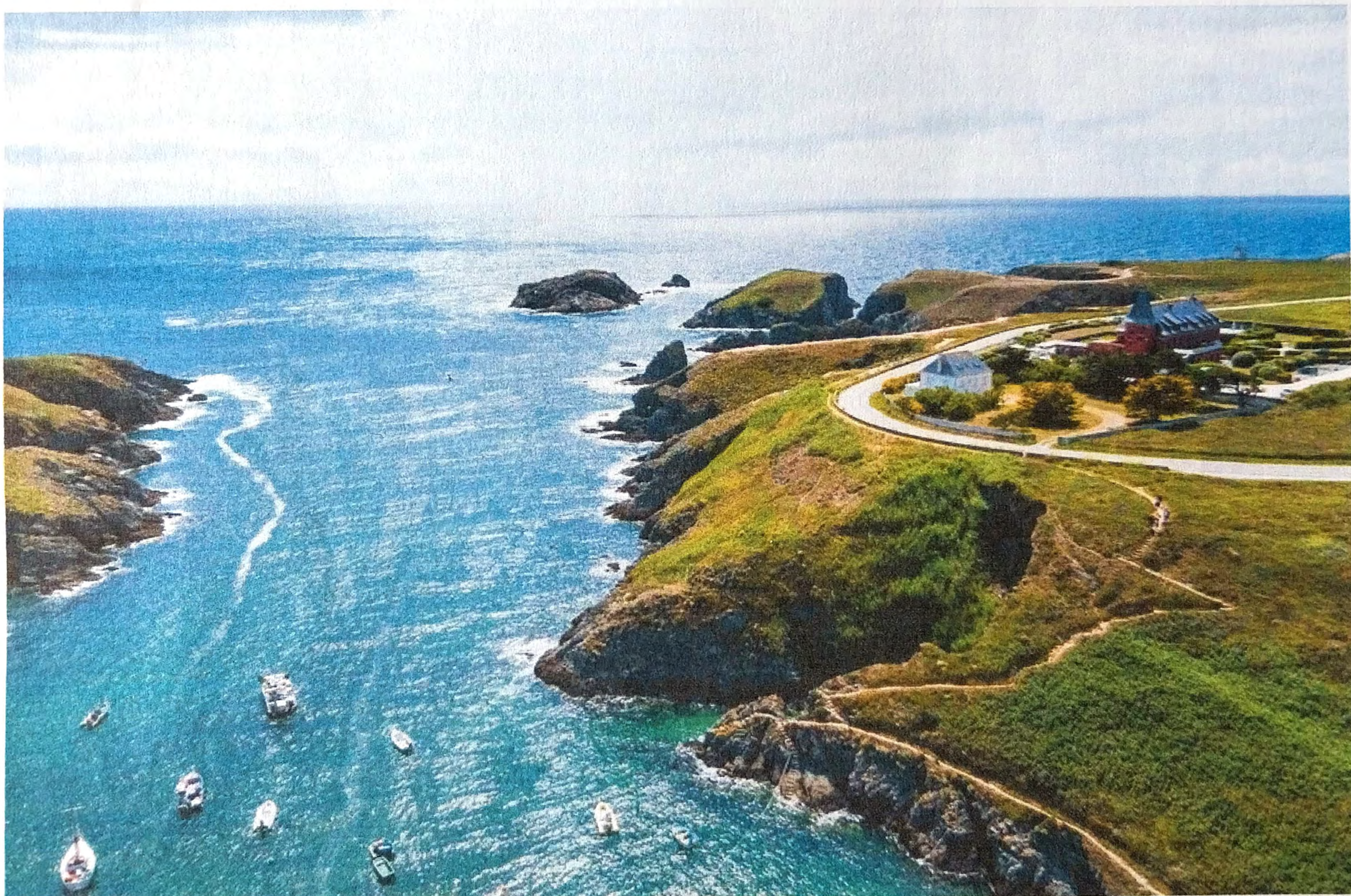
Belle-Île-en-Mer - © Castel Clara

Panoramas grandioses, nature préservée, sites chargés d'histoire... Depuis l'un des hôtels de Belle-Ile-en-Mer que nous avons sélectionnés, cédez à une immersion sur cette pépite bretonne, campée au large de Quiberon.